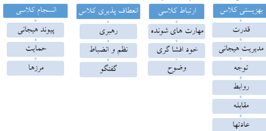
شکل ۲. مدل سیستمی شکوفایی کلاس (FCSM) (Allison et al., 2020).

عادت‌ها به سبک زندگی و رفتارهایی گفته می‌شود که با بهزیستی ارتباط دارد. اهداف به معنی تعهد به خودتنظیمی است که مسیری برای افراد به وجود می‌آورد تا آن‌ها بتوانند موقعیت‌های مربوط به شایستگی را تفسیر کنند و به آن‌ها پاسخ بدهند (Sommet & Elliot, 2016). عادت‌ها و اهداف با یکدیگر تعامل دارند، ایجاد هدف مهم برای تغییر عادت‌ها هستند (Waters & Loton, 2019). کلاسی که به‌طور معمول و جمعی در ذهن آگاهی شرکت می‌کنند منجر به ایجاد عادت بهزیستی گروهی می‌شوند. استفاده از تمرین‌های مربوط به علم آموزش باعث افزایش فعالیت‌هایی می‌شود که معلم، اهداف و مقاصد یادگیری را تعیین می‌کند تا آنچه هدف جمعی کلاس است به دست آورد (Hattie & Zierer, 2018). مدل سیستمی شکوفایی کلاس نشان می‌دهد چگونه انسجام، انعطاف‌پذیری، ارتباطات، بهزیستی در ارتباط با یکدیگر بر یادگیری جمعی و بهزیستی اثر می‌گذارند.