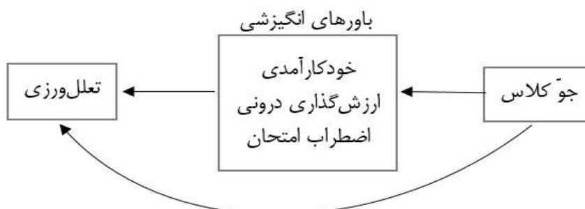
نمودار ۱. مدل پیشنهادی پژوهش نقش واسطه‌ای باورهای انگیزشی در ارتباط بین جوّ کلاس و تعلل‌ورزی

به نقل از عابدینی، باقریان و کدخدایی، (۱۳۸۹) و پولسون و جنتری ۱ (۱۹۹۵)؛ به نقل از عابدینی، باقریان و کدخدایی، (۱۳۸۹) اشاره کرد. با توجه به آنچه بیان شد می‌توان گفت از جمله عوامل موقعیتی که بر عملکرد تحصیلی دانش‌آموزان و دانشجویان اثر مهمی دارد جوّ کلاس می‌باشد؛ دانش‌آموزان و دانشجویانی که ادراک آن‌ها از جوّ کلاس مثبت است، تکلیف کلاسی را برای آینده‌ی خود سودمند تلقی می‌کنند و این امر می‌تواند در کاهش میزان تعلل‌ورزی مفید باشد؛ و از سوی دیگر مؤلفه‌های باورهای انگیزشی (خودکارآمدی، ارزش‌گذاری درونی و اضطراب امتحان) نیز می‌توانند در رابطه‌ی بین ادراک از جوّ کلاس و تعلل‌ورزی یک نقش واسطه‌ای را ایفا کنند؛ بنابراین هدف این پژوهش بررسی نقش واسطه‌ای باورهای انگیزشی در رابطه‌ی ادراک از جوّ کلاس و تعلل‌ورزی دانشجویان در قالب یک مدل است.