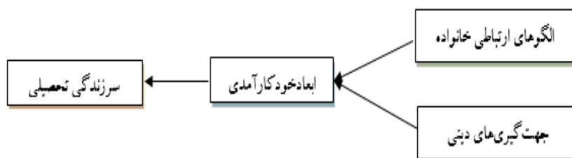
نمودار ۱. مدل علی فرضی پژوهش